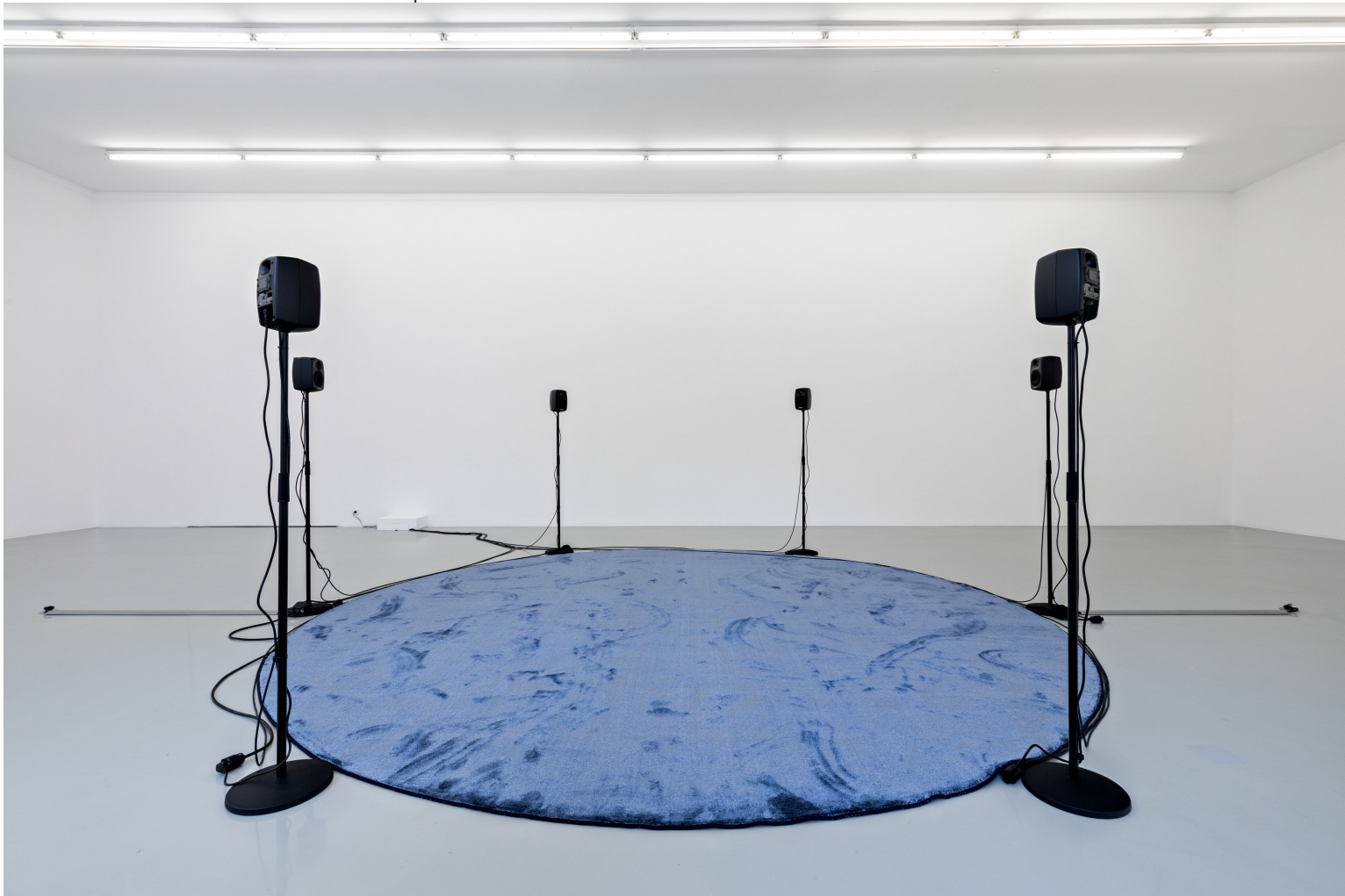
Hanne Lippard, Anonymities , 2017 Expositions Le Langage est une peau , septembre 2021 - février 2022 49 Nord 6 Est-Frac Lorraine, Metz.

Le langage est une peau met en jeu la désobjectivisation de l'œuvre d'art autant que celle du corps féminin, à l'heure d'une quatrième vague féministe. À travers une mise en scène de notre propre obsolescence programmée, Hanne Lippard invite à repenser l'exposition comme espace utopique, celui d'une émancipation possible face à un monde dans lequel il faut donner voix.